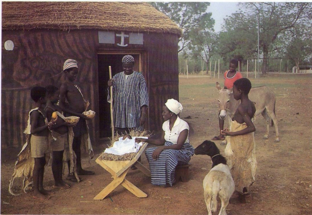
Tijdens het 100 jarig bestaan van het Christendom in Ghana speelde de lokale bevolking in het noorden van het land het kerstverhaal na met een levende kerststal.

U ontvangt deze Rondzendbrief per post, omdat wij van u geen emailadres hebben of een onjuist emailadres. Wilt u in dit geval uw (nieuwe) emailadres sturen naar: jydbroek@kpnmail.nl , samen met uw naamgegevens, uw adres, postcode en woonplaats. Om kosten en papier te sparen, willen we u vragen om hier – zo mogelijk – gevolg aan te geven.